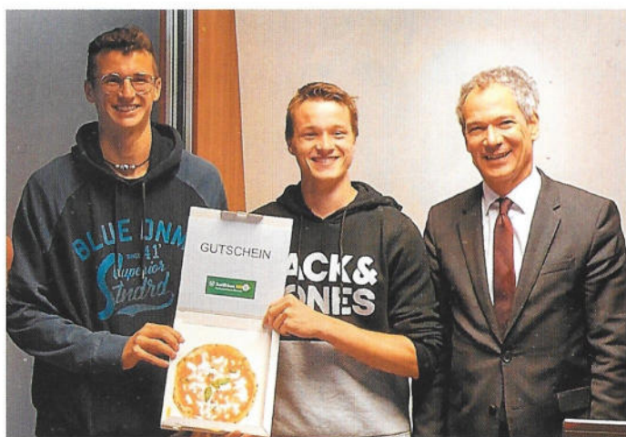
Das Siegerteam mit dem ersten Rang: Alle Sieger bekamen Gutscheine.

Sparen, Vorsorgen und Absichern: Wie wichtig diese Dinge im alltäglichen Leben sind, das haben die Schülerinnen und Schüler mehrerer Klassen der TFO Bruneck durch die Teilnahme an einem Finanzquiz ganz praktisch in Erfahrung bringen können. Die punktemäßig besten, aber auch kreativsten Teams wurden bei einer Veranstaltung der Raiffeisenkasse Bruneck prämiert.