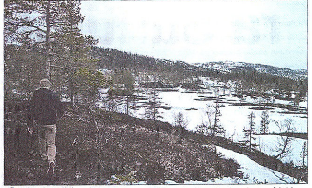
SÜDTIROLERNE prøvde å se elg, men til tross for iherdige forsøk uten å lykkes.