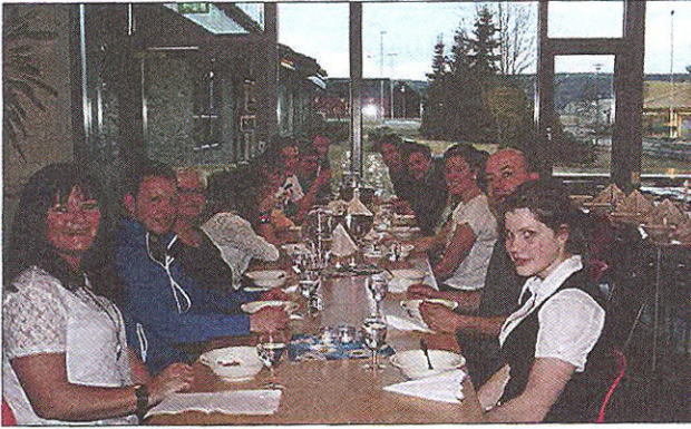
AVSKJEDSFESTEN på skolen.