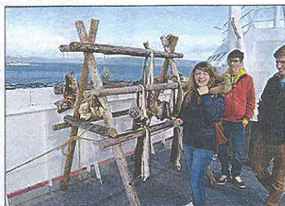
ET FØRSTE FORSIKTIG MØTE med tørfisk om bord på Hurtigruten.

Hvordan var det for dere å komme til en norsk utkant-kommune? «Her i Selbu kommune har dere et system som fungerer godt, sett med våre øyne. Man får alt man trenger: Hus, butikker, bensinstasjon, skoler. Så har Selbu en sentral beliggenhet, både i forhold til flyplassen og i forhold til byen. Selv om man kan føle seg ved verdens ende, så har man alle muligheter. Og til tross for den økonomiske krisen i Europa