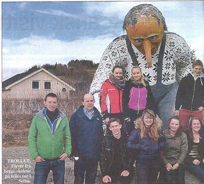
TROLLET: Elevene fra begge skolene på felles tur i Selbu.