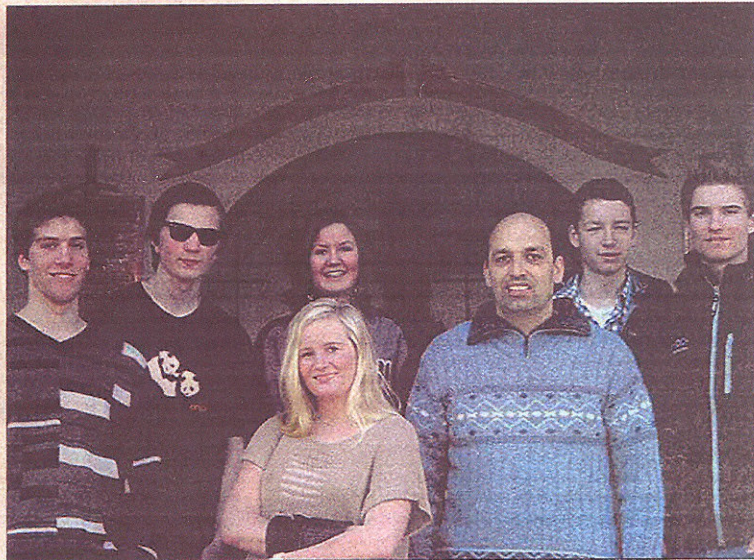
HER ER VI på en liten tur og endte opp ved en gammel kirkegård.