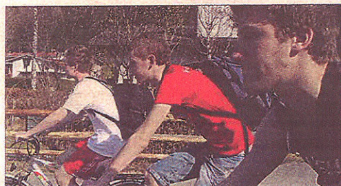
UT PÅ TUR aldri sur! Sykkeltur med elevene vi bodde hjemme hos.