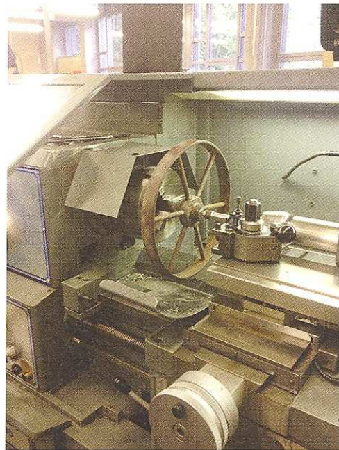
Das Rad aus dem Ersten Weltkrieg